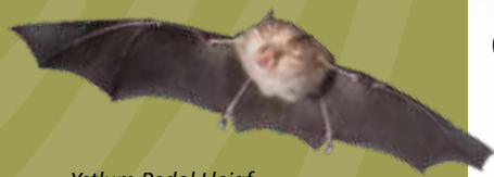
Ystlum Pedol Lleiaf Lesser Horseshoe Bat